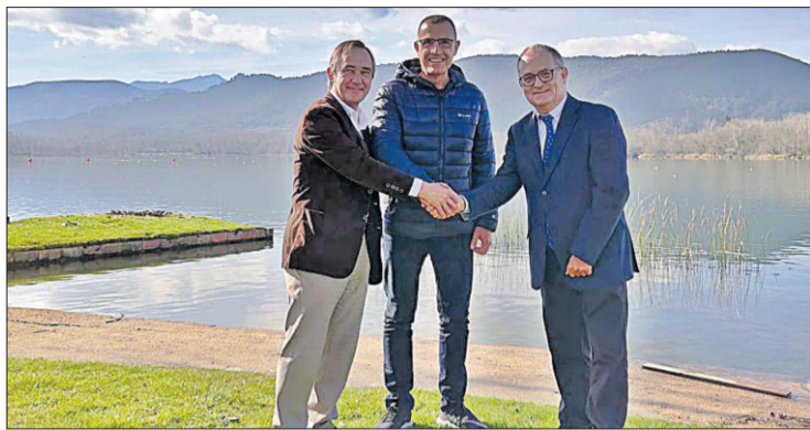
Representants del CNB i la Clínica Salus en la signatura. SALUS